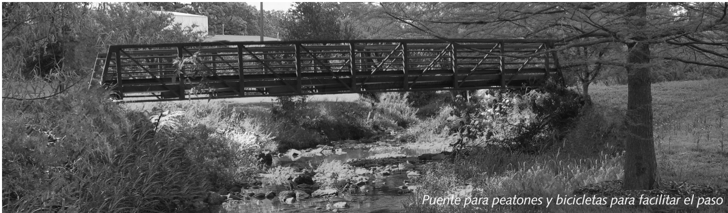
Puente para peatones y bicicletas para facilitar el paso