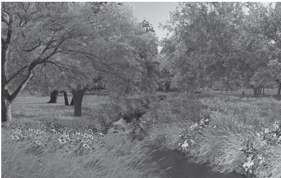
El proyecto de Tannehill creará parques y bosques ribereños

El vecindario JJ Seabrook ha tomado un papel muy activo al trabajar con la Ciudad en los planes de éste proyecto. De hecho, miembros de Watershed