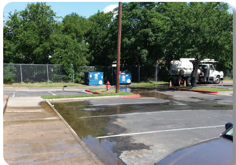
Los derrames de aguas negras constituyen un riesgo a la salud pública y pueden afectar negativamente el valor de su propiedad.