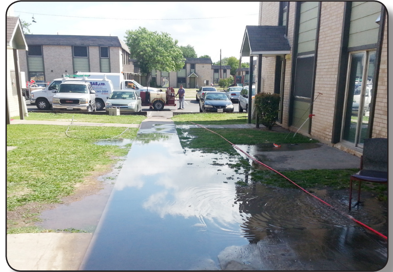
Derrame de aguas negras en un complejo de apartamentos en Austin.