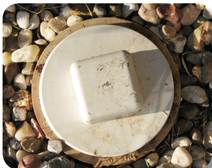
La tapa al acceso del drenaje es típicamente 4" en diámetro.

Si es posible desvíe el derrame de aguas negras para evitar que entre a los drenajes fluviales donde podría alcanzar el sistema de aguas de ríos y arroyos.